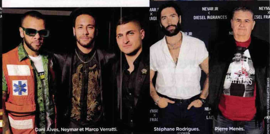
Dani Alves, Neymar et Marco Verratti.