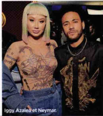
Iggy Azalea et Neymar.