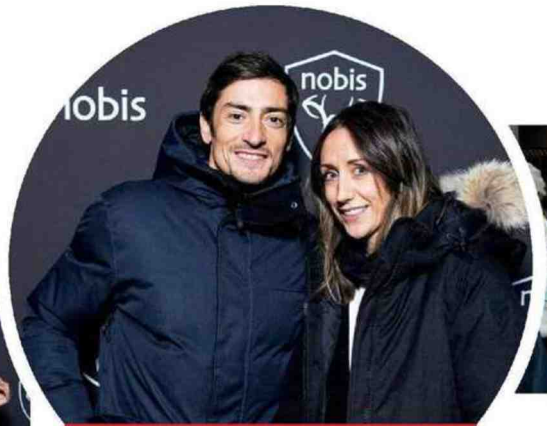
NOBIS FÊTE SON 15 e ANNIVERSAIRE