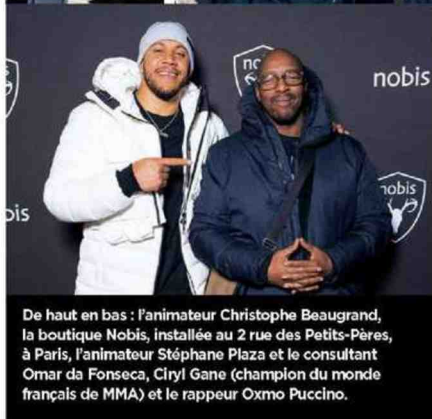
De haut en bas : l'animateur Christophe Beaugrand, la boutique Nobis, installée au 2 rue des Petits-Pères, à Paris, l'animateur Stéphane Plaza et le consultant Omar da Fonseca, Ciryil Gane (champion du monde français de MMA) et le rappeur Oxmo Puccino.